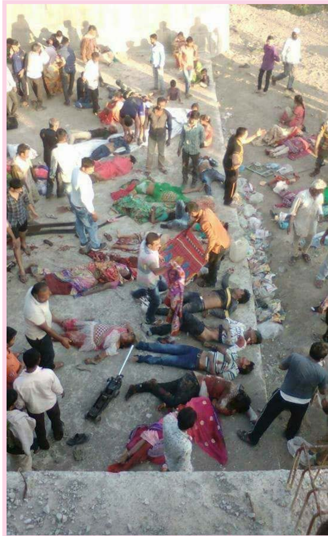
...સૌરાષ્ટ્રના ઈતિહાસનો સૌથી ગંભીર અકસ્માત...રાજકોટ ભાવનગર હાઈવે પર રંધોળાના પુલ પરથી જાન ભરેલો બટારો નિચે ખાબકતા ઉપ જેટલા જાનેયાઓ ના સ્થળ પરજ કચ્છ મૃત્યુ...અનેક ગંભીર...ભગવાન તેમની આત્માને શાંતિ આપે...ૐ શાંતિ.શાંતિ.