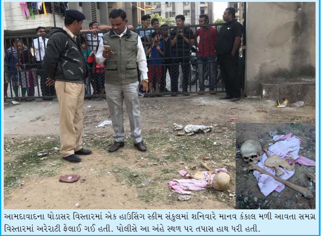
અમદાવાદના ઘોડાસર વિસ્તારમાં એક હાઉસિંગ સ્કીમ સંકુલમાં શનિવારે માનવ કંકાલ મળી આવતા સમગ્ર વિસ્તારમાં અરેરાટી ફેલાઈ ગઈ હતી. પોલીસે આ અંદે સ્થળ પર તપાસ હાથ ધરી હતી.