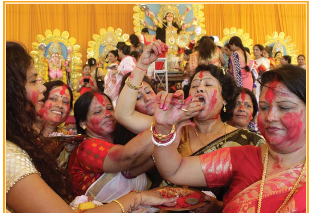
બંગાળી સમાજ દ્વારા નવરાત્રી પર્વ દરમિયાન ઉજવાતી ચાર દિવસીય દુર્ગા પૂજાના સમાપન નિમિત્તે અમદાવાદના ઈસનપુર ખાતે માં દુર્ગા ચેરીટેબલ ટ્રસ્ટના પંડાલમાં સૌભાગ્યવંતી મહિલાઓએ એકબીજા પર સિંદૂર કાગવી તેમની પરંપરાગત 'સિંદૂર ખેલા' વિધિ કરી ત્યારે તેમના ખીલી ઉઠેલા ચહેરા પર પર્વનો આનંદ છલકી રહ્યો છે.

મંદિર તરફ જતા રસ્તાને વાહનો માટે બંધ કરી દેવામાં હતા. મંદિર સુત્રોનાં કહેવા મુજબ આ વખતે લાખો ભક્તોનો ધસારો રહ્યો હતો અને માતાની પલ્લી ઉપર લાખોના શુદ્ધ ઘીનો અભિષેક કરવામાં આવ્યો હતો. ગાંધીનગરથી ૧૨ કિલોમીટરના અંતરે સ્થિત રૂપાલ ગામની ઓળખ પલ્લી તરીકે વધારે થાય છે. અહીં શુદ્ધ ઘીની નદીઓ નવરાત્રી દરમિયાન જોવા મળે છે. નવરાત્રી દરમિયાન નોમના પલ્લીનું આયોજન કરાય છે. પૂજા અર્ચનામાં અનાજ, કઠોળ, ઘીનો ઉપયોગ કરવામાં આવે છે. નોમના દિવસે પલ્લીની શરૂઆત સવારથી જ કરવામાં આવે છે અને માતાજીનો પંચબલી યજ્ઞ કરવામાં આવે છે. પલ્લીના કાર્યમાં ગામના લોકો જોડાઈને માતાજીની સેવાનો હવાવો લેતા હોય છે. પલ્લીને કુલોથી શણગારવામાં આવે છે. રૂપાલમાં બિરાજતા વરદાયિની માતાજી પૌરાણિક મહત્વ પણ ધરાવે છે. ભારે ઉત્સાહ દેખાયો હતો.